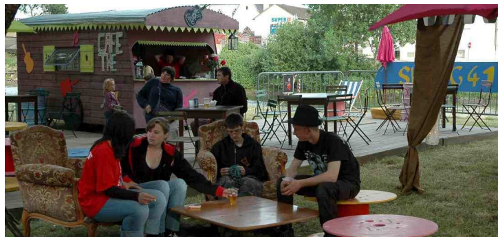
Certains sont déjà à leur aise.

Tandis que, plus loin, un groupe de jeunes a élu domicile dans un petit salon de plein air, au bord de l’eau.