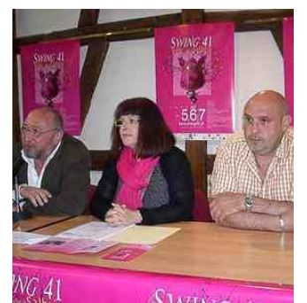
Le maire de Salbris avec son adjointe à la culture et le président des bénévoles.